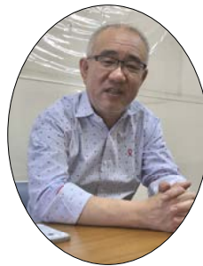
鳥料理 玉ひで 八代目主人